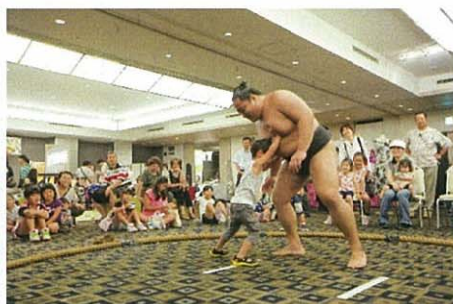
春日山部屋力士と相撲体験 ※昨年風景