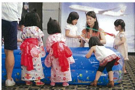
楽しい緑日コーナーが盛りだくさん！ ※昨年風景