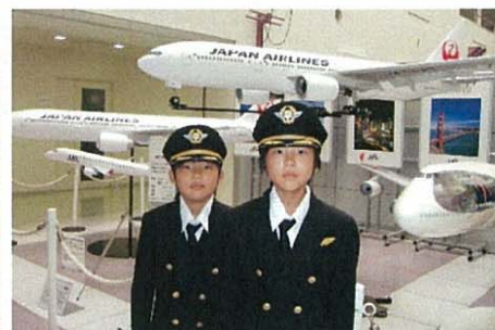
JAL ちびっこ制服撮影会 ※写真はイメージ（JAL スカイミュージアムにて）