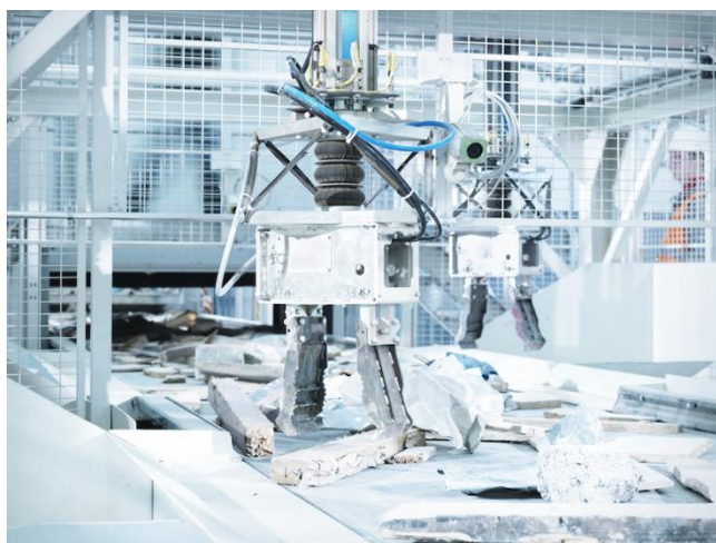
【ゼンロボティクス製品写真】