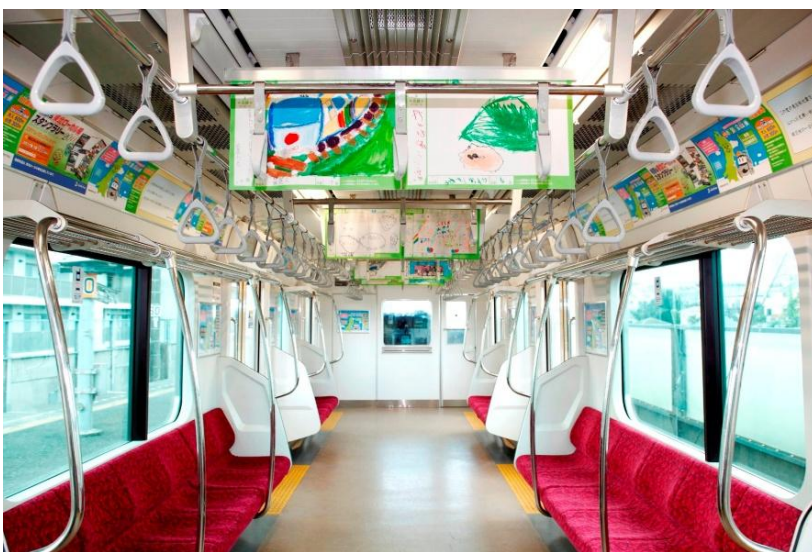
過去に実施した電車内絵画展