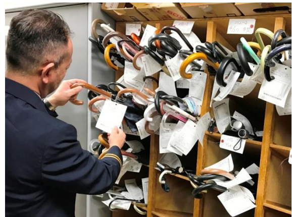
二俣川駅お忘れ物センター

お忘れ物ランキングでは、傘のお忘れ物が最も多く、22,671件（同5.2%減）となり、お忘れ物全体の約27%を占めます。傘のお忘れ物が最も多くなるのが梅雨や台風の時季にあたる6月と9月で、この2カ月で傘の忘れ物全体の約28%を占めます。第2位は袋・封筒類で7,444件（同0.2%増）となり全体の約9%、第3位は現金で5,839件（同10%増）となり全体の約7%でした。お忘れ物の返還は24,477件でお忘れ物全体の28.9%と低いのが現状です。また、珍しいお忘れ物には自転車やかつら、刀等がありました。