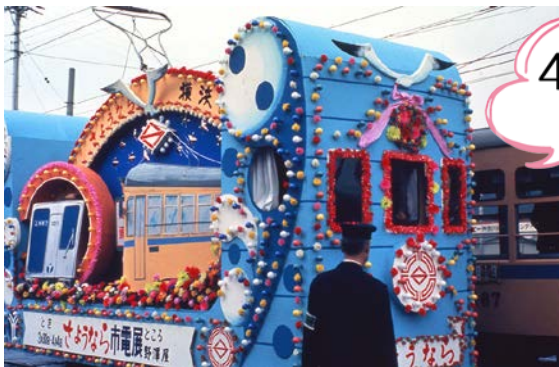
昭和 47 年当時の花電車

初日には、「花電車」点灯式の後、様々なイベントを実施するほか、磯子区にスポットを当てた写真展やトークショーを開催、市電保存館全体で磯子区制 90 周年事業を盛り上げてまいります。