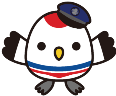
臨港バス新キャラクター

80周年を記念し、かつて鶴をシンボルマークに使用していた経緯から、その伝統を受け継ぎ、鶴を現代風にキャラクター化しました。お腹には臨港バスの車体にデザインされているラインと同じ色を使用し、臨港バスのキャラクターだと視認できるデザインとしました。