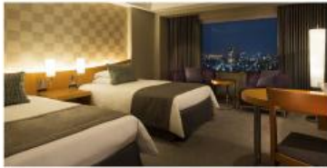
セルリアンタワー東急ホテル ペア宿泊券