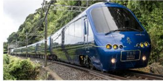
THE ROYAL EXPRESS ペア乗車券