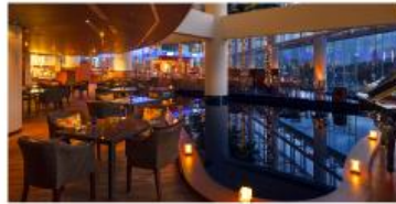
横浜ベイホテル東急 ペアディナー券