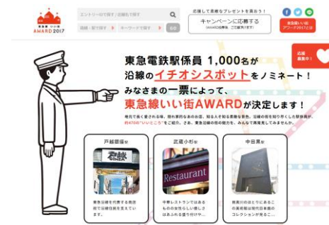
公式ホームページイメージ