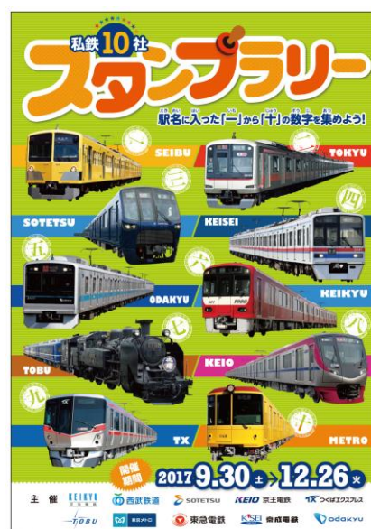
【スタンプシート表紙（イメージ）】