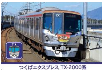
つくば エクスプレス