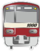
私鉄10社のオリジナルピンバッジ (イメージ)