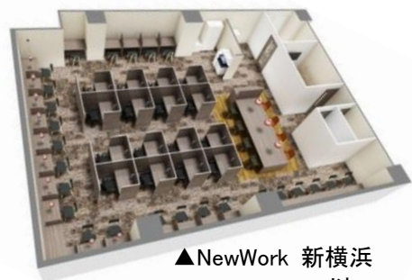
▲NewWork 新横浜 以上

参考)本日、この資料は国土交通記者会、経済産業省記者クラブ、都庁記者クラブ、川崎市政第一記者会、横浜経済記者クラブにお届けしています。