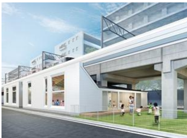
▲綱島こども園(仮称)イメージ図