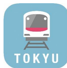
東急線アプリアイコン