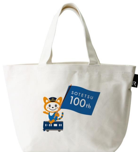
「そうにゃんルートート」(イメージ)