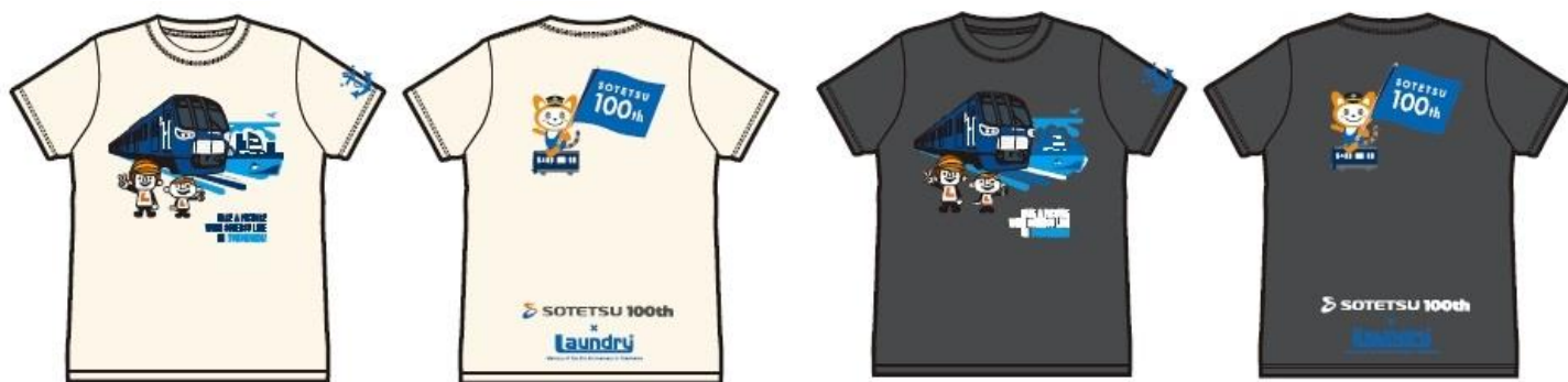
電車（20000系）とそうにゃんがデザインされたTシャツ（イメージ） アイボリー（左）とチャコール（右）