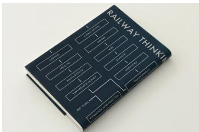
相鉄線の路線図をモチーフにした文庫カバー(イメージ)