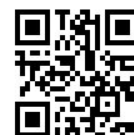
公式ウェブサイト