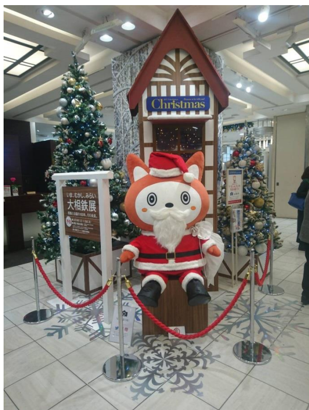
サンタクロース姿の「そうにゃん」(イメージ)

フォトコーナーには相模鉄道キャラクター「そうにゃん」もサンタの衣装で参加。インスタ映え間違いなしのフォトコーナーとして盛り上げます。