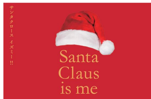
ビジュアルイメージ