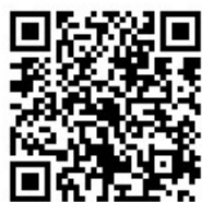
公式ウェブサイト

Twitter: https://twitter.com/yokohama_kurasu